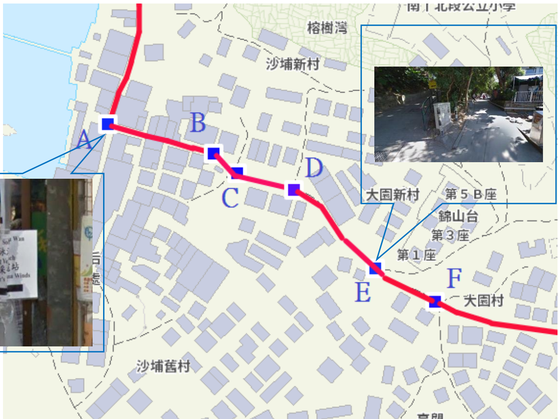
A: Turn left; E: Take the right path